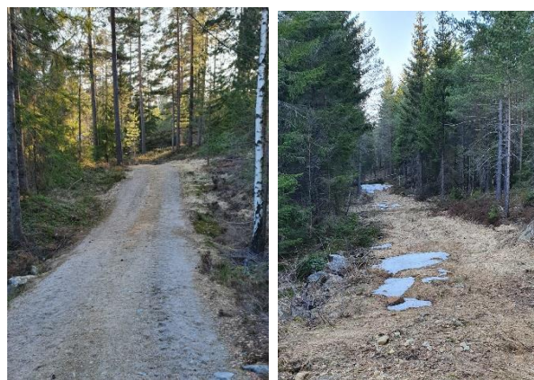
Traktorveier fra område i korridor øst